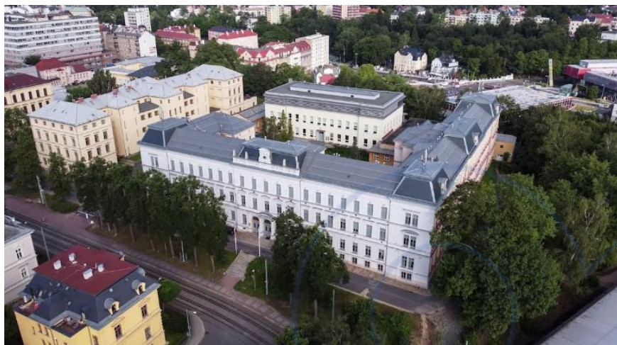
Masarykova 3, Liberec